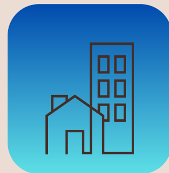
construcción y mantenimiento