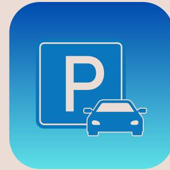
servicios de parking