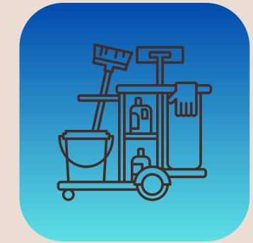
servicios de limpieza