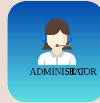
servicios de auxiliares